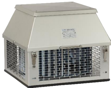
Modell HQ (quadratisch)