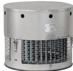
Modell HR (rund)