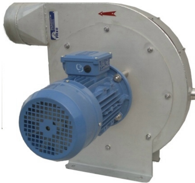
Abbildung und Explosionszeichnung eines Mitteldruckventilators